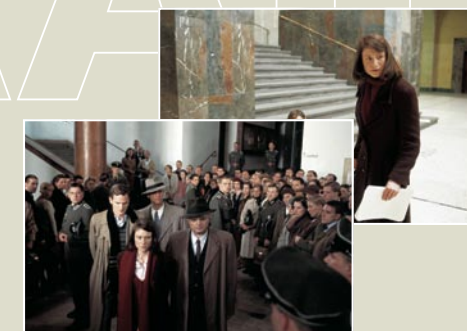
SOPHIE SCHOLL - DIE LETZTEN TAGE, D 2005, R: Marc Rothemund, D: Julia Jentsch, Alexander Held, FSK ab 12 Jahre