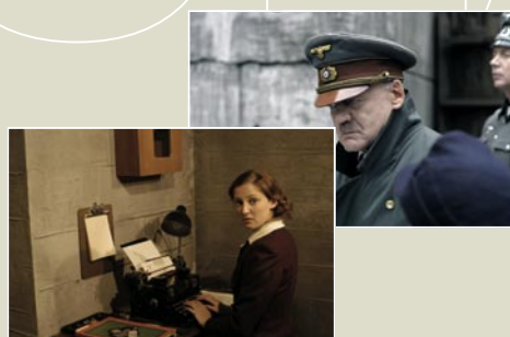
DER UNTERGANG, D 2004 R: Oliver Hirschbiegel, D: Bruna Ganz, Alexandra Maria Lara, FSK ab 12 Jahre