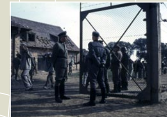
DIE GRAUZONE (The Grey Zone), USA 2001, R: Tim Blake Nelson, D: David Arquette, Harvey Keitel, FSK ab 16 Jahre