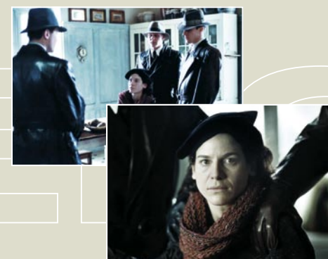
DER NEUNTE TAG, D/ Luxemburg 2004, R: Volker Schlöndorff, D: Ulrich Matthes, August Diehl, FSK ab 12 Jahre